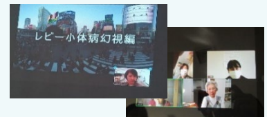
VRを使った、認知症体験会の様子

高齢者が住み慣れたまちで安心して暮らせるまちづくりを目指し、地域のボランティアのフォローアップ研修を実施しました。