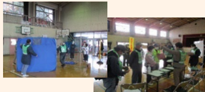
避難所開設・運営訓練の様子

校区防災連絡会・避難所運営委員会を主体として、実態に即し感染症対策を踏まえた避難所開設・運営訓練を実施しました。