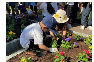
地域による緑化活動