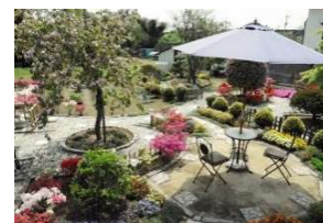
オープンガーデン