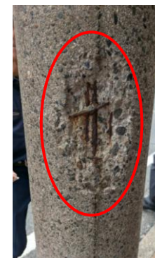
表面剥離状況写真