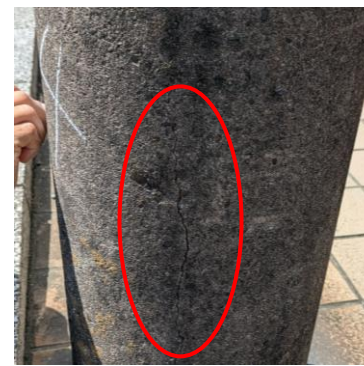
ヒビ割れ状況写真