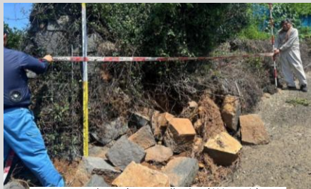
西区河内町白浜 農地(樹園地) 石垣崩壊L=4.3m