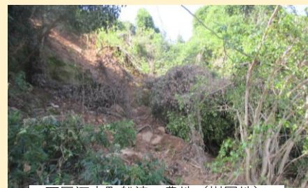
西区河内町船津 農地(樹園地) 法面崩壊L=16.0m