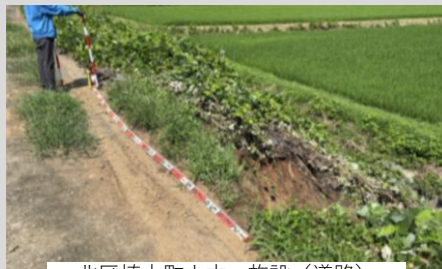
北区植木町山本 施設(道路) 路肩崩壊L=5.0m