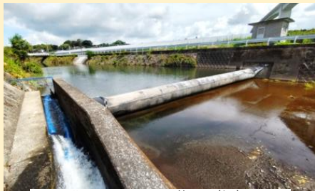
北区下碓川町 施設(堰) 頭首工復旧N=1箇所