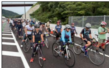
【サイクリングの様子】