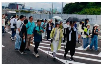
【ウォーキングの様子】