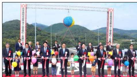
【テープカットの様子】