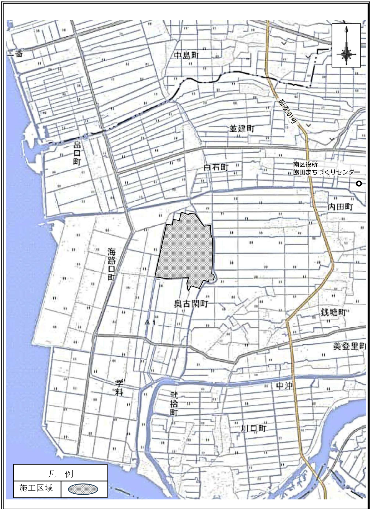
位置図（南区銭塘町外地域）