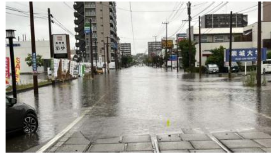
道路冠水状況(中央区段山本町)