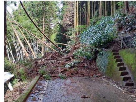
(D) (県道)小天下硯川線(西区河内町)