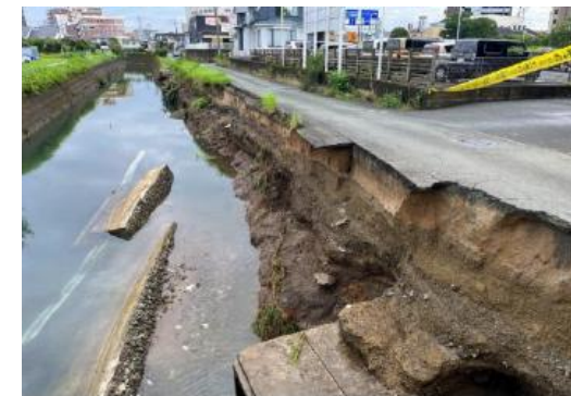
(A) 健軍川(東区神水本町)