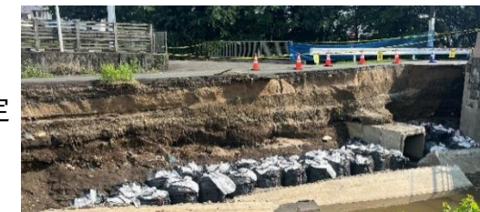
(A) 健軍川(東区神水本町)