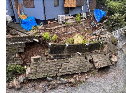
(C) 普通河川(小山田川)(西区島崎)