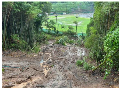
(B) (市道)徳王町貢町第1号線(北区徳王)