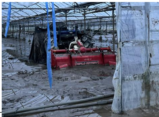
トラクターの水没