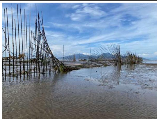
二枚貝保護区漁場を区切るFRP支柱の倒壊