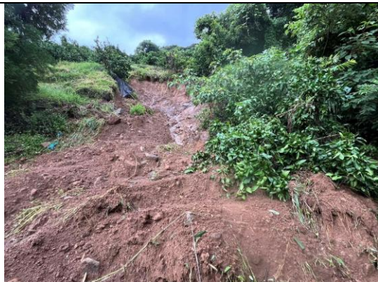
倒木した樹木 (うんしゅうみかん)