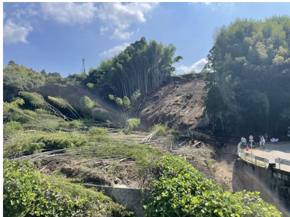
斜面崩壊による農地・里道・用排水路への土砂堆積