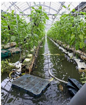
浸水したナスのハウス