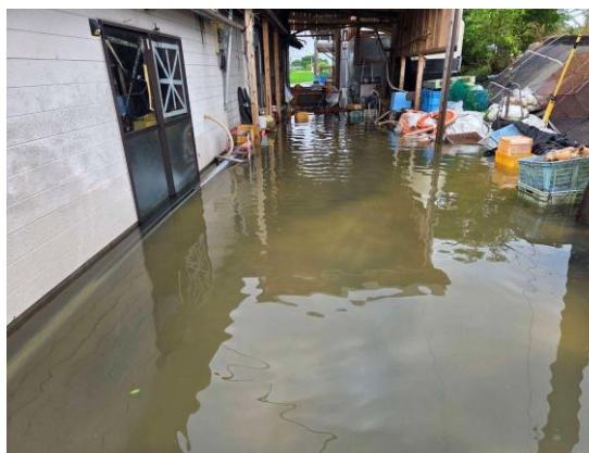
ノリ加工施設の浸水