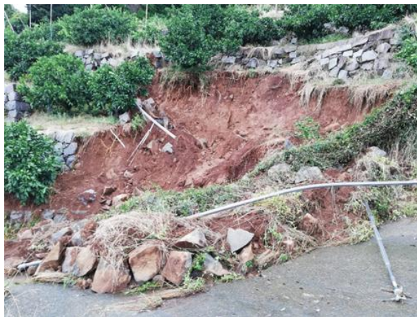
樹園地の石垣崩落