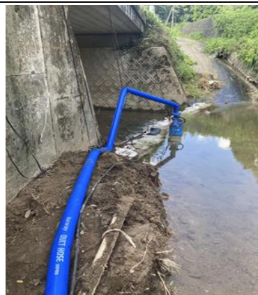
応急措置として用水ポンプにより農業用水の確保