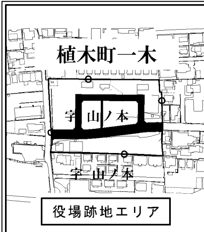
現町界字界図 (植木町植木、植木町舞尾、植木町滴水、植木町一木)