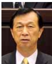
藤山 英美 議員

質問 1 日本一暮らしやすい政令市とは何か 暮らしやすさの実感是人によって異なるし、時代と共に変化する。政令市スタートの今、定義しておくべきでは。