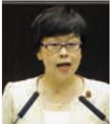
三森 至加 議員