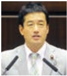
山部 洋史 議員