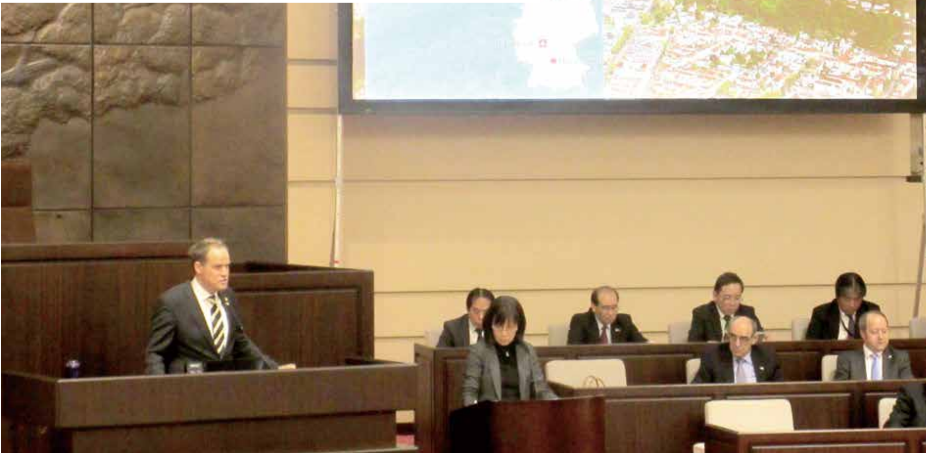
ドイツ・ハイデルベルク市訪問団の歓迎式典