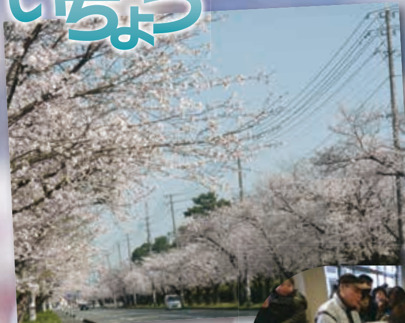
【東区】 健軍自衛隊通りの桜