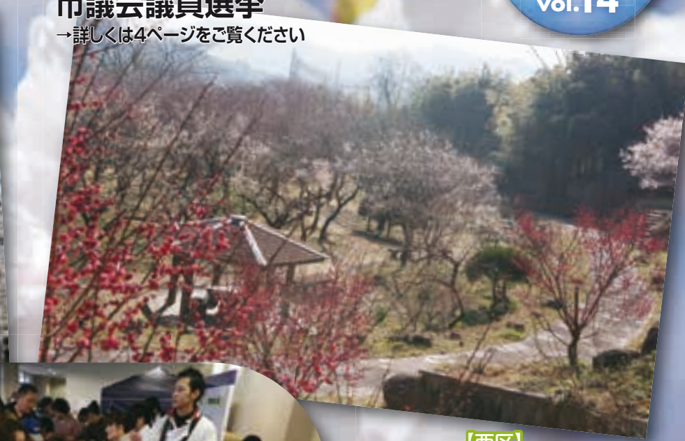
【西区】 谷尾崎梅林公園の紅梅