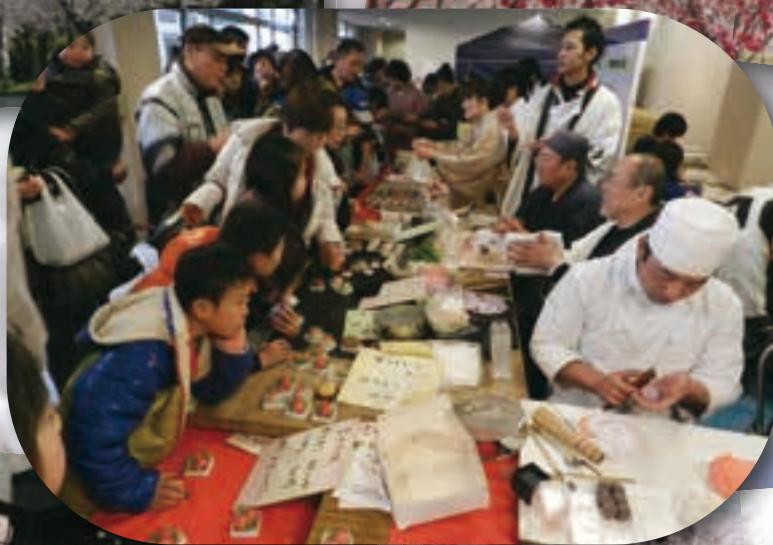
【中央区】 城下町くまもと 肥後のひなまつり (2月27日～3月8日開催)