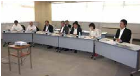
富山市「富山型デイサービスの説明」