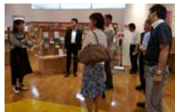
沖縄市「市立図書館の説明」