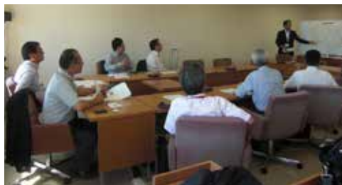
函館市「投票率向上策の説明」