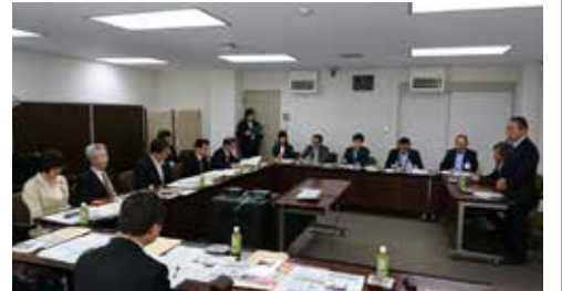
葛飾区「空家等対策の説明」