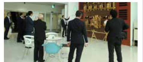
八戸市「はっち」での伝統工芸の説明